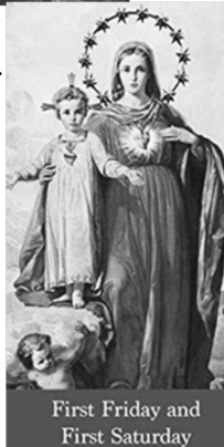
First Friday and First Saturday

And that every tongue should confess that the Lord Jesus Christ is in the glory of God the Father." Philippians 2:10-11