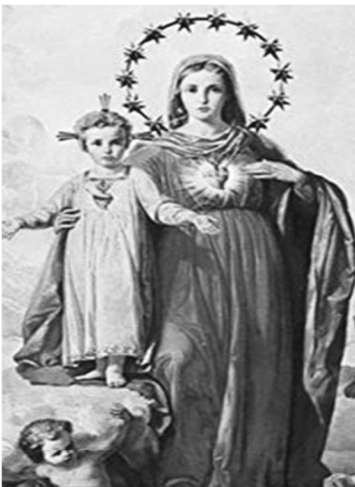
First Friday and First Saturday

This indulgence can be obtained either on the day mentioned above or, with the consent of the ordinary, on the preceding or following Sunday or on the solemnity of All Saints. This indulgence is already contained in the apostolic constitution, Indulgentiarum doctrina, norm 15. It is included here in light of the Sacred Penitentiary's deliberations since the constitution was issued. According to norm 16 of the apostolic constitution, this visit is to include the "recitation of the Lord's Prayer and the Creed (Pater and Credo)."