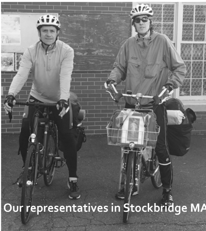
Our representatives in Stockbridge MA

First Friday We will be visiting the sick and taking Communion to them on First Friday, June 7th. Adoration - 6:30 PM, Confessions-6PM, First Friday Mass - 7PM.